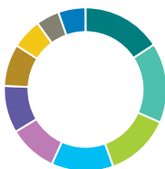
Répartition sectorielle (%)