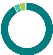
Répartition de l'actif (%)