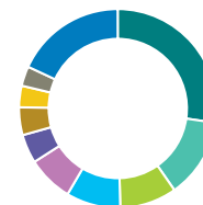
Répartition sectorielle (%)