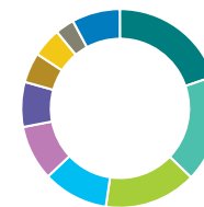
Répartition sectorielle (%)