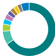
Répartition géographique (%)