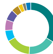
Répartition sectorielle (%)