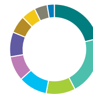
Répartition sectorielle (%)