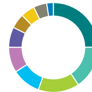
Répartition sectorielle (%)