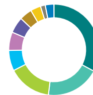
Répartition sectorielle (%)