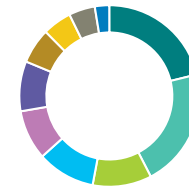
Répartition sectorielle (%)